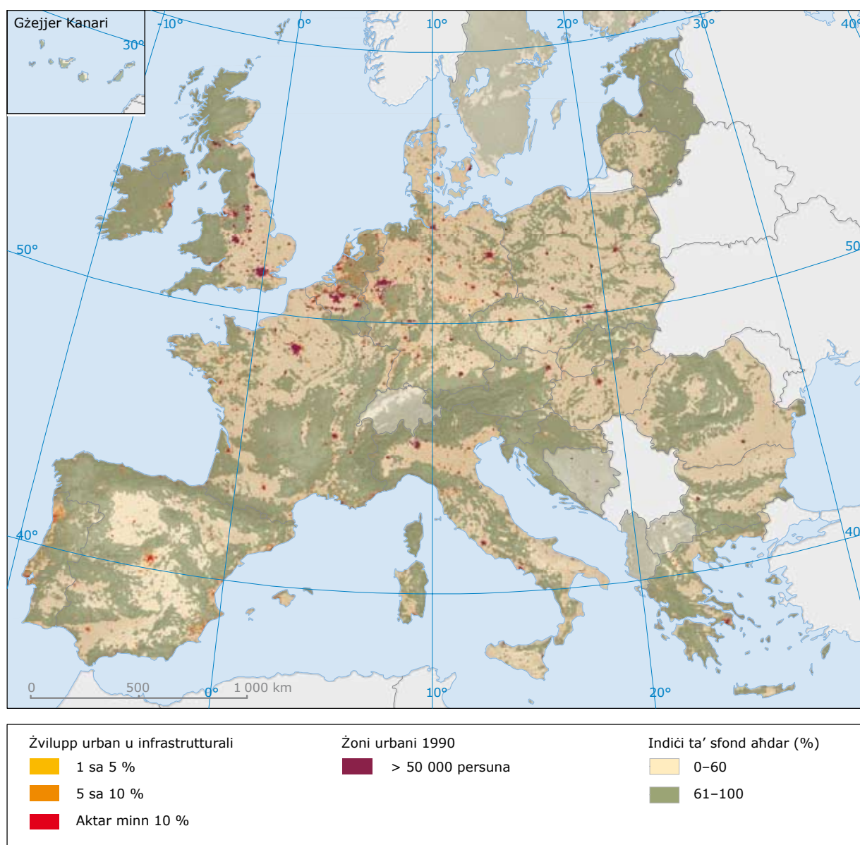
Figura 1 Espansjoni urbana mhux ikkontrollata u żvilupp artifiċjali ieħor ta' l-art, 1990–2000

it-tendenza li jkunu inqas f'żoni urbani meta mqabbla ma' żoni b'popolazzjonijiet imxerrda. L-iskart urban u t-trattament ta' ilma wżat igawdu minn ekonomiji ta' skala. Sussegwentement, problemi tradizzjonali tas-saħħa marbuta ma' l-ambjent minn ilma tax-xorb mhux sigur, faċilitajiet sanitarji mhux adegwati u