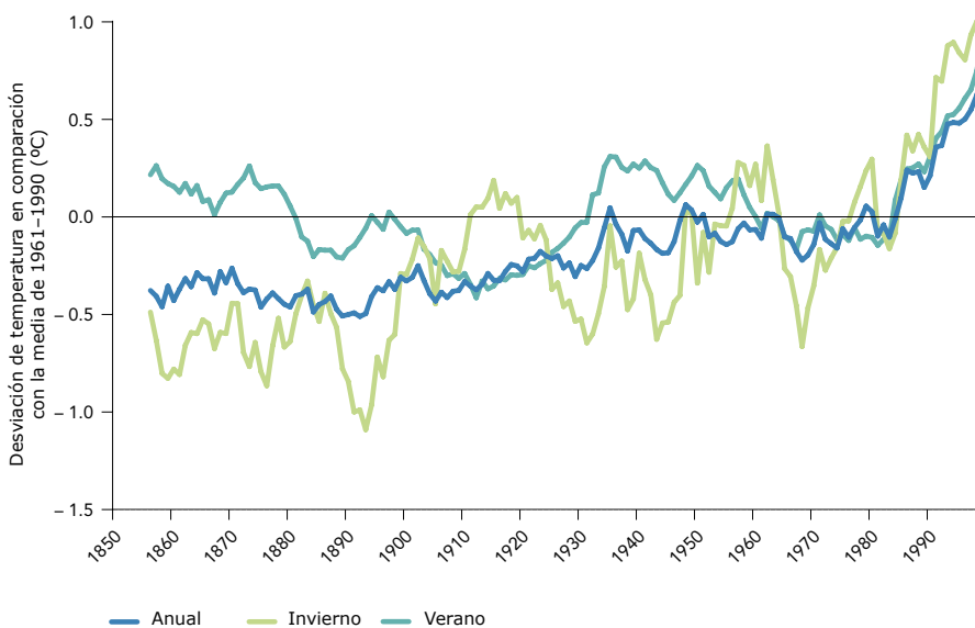
Gráfico nº 1 Desviaciones de la temperatura anuales, invernales y estivales en Europa 1850–2000